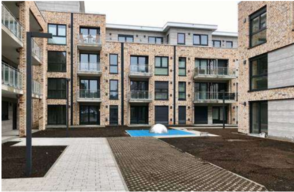
Lessinghöfe, Neu Wulmstorf

Die Gemeinde Neu Wulmstorf im Landkreis Harburg profitiert von einer guten öffentlichen Verkehrsanbindung: Die S-Bahnstation ermöglicht eine schnelle und direkte Anbindung an das Hamburger Verkehrsnetz. Der «Jungfernstieg» ist in circa 30 Minuten erreichbar.